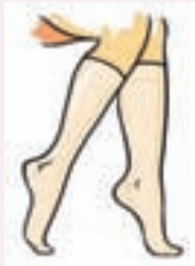
Varisleri ortadan kaldırmaz ancak devamlı ve uygun kullanımı ile şikayetleri ve varislerin ilerlemesini azaltır.

Varisin tedavisi varisin derecesine, tipine, hastanın şikayetine, isteğine ve ultrason bulgularına bağlı olarak ciddi değişiklikler gösterir. Hastanın tedaviden beklentisi, elde ne tip teknolojilerin olduğu, ekibin deneyimi, girişimi yapacak kişinin ultrason deneyimi gibi faktörler tedavinin başarısını belirleyen çok önemli faktörlerdir. Aşağıda bahsedilen yöntemlerin birinin veya birkaçının beraber seçilmesi tecrübeli bir ekibin tüm verileri hastayla çok açık olarak tartışmasıyla gerçekleşmelidir. Her hastaya uyabilecek tek bir yöntem yoktur.