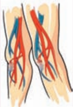
Bacağa temiz kan atar damarlarla gelir (kırmızı). Kirli kan kalbe toplar damarlarla (mavi) döner.

Kalp akciğerden gelen temizlenmiş kanı atar damarlarla vücudun her köşesine pompalayarak yollar. Dokular tarafından kullanılan kan toplar damarlar tarafından tekrar kalbe döner. Toplar damarlarda kirli kanın aşağıdan yukarıya doğru ve yerçekimi etkisinin de üstesinden gelerek ve arkada bir pompa da olmaksızın akabilmesinin iki temel nedeni vardır. Bunlardan birinci ve en önemli neden toplar damarlar içinde çok özel bir kapakçık sistemi olması ve ikincisi de toplar damarların etrafındaki yoğun kas kitlesidir. Bacak kaslarının her kasılışı esnasında toplar damarlar