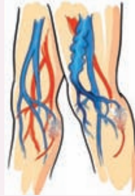
Kapakçıkların fonksiyonun bozulması sonucu kan aşağıya kaçır ve yüzeysel toplar damarlar genişleyerek varis oluşur.

Varis damarları genellikle bacağın iç kısmında veya baldırın arkasında görülürler. Kimi zaman ufak ve mavi-mor damar genişlemeleri şeklinde ve kimi zamansa adeta bir parmak kalınlığına varacak şekilde olabilir varisler. Bu damarlar yukarıda bahsedildiği gibi basınç artmaya devam ettiği müddetçe daha da genişlerler ve iyice şiş ve kıvrımlı vaziyete gelirler.