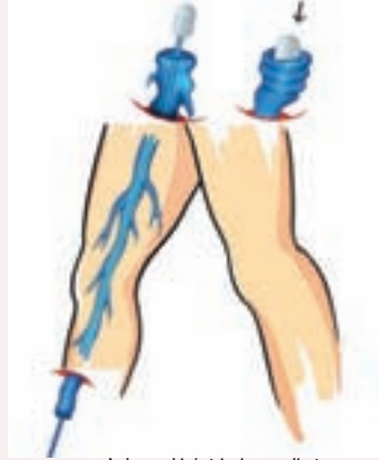
Açık cerrahi / stripping ameliyatı Genel anestezi altında kasıkta ve bacakta yapılan kesilerden stripper teli kullanılarak ana yüzeysel damar çıkarılır. Damar içi lazer yönteminin gelişmesi sonucu sadece % 10 hastada açık cerrahi kullanılmaktadır.

Yüzeysel toplar damarların açık cerrahiyle çıkarılması çok uzun yıllardır kullanılan ve "stripping" olarak bilinen bir yöntemdir. Kasıkta ve bacakta birkaç yerde kesiler yapılarak toplar damar içine "stripper" denilen bir tel sokulur ve tüm yüzeysel toplar damar bir uçtan diğer uca çekilerek çıkarılır. Çekme sırasında yan dallarının kopması sonucu oluşacak kanamayı önlemek için biz tüm bacağı özel bir basınç balonu uygulayarak işlem sırasında oluşacak kanamaları önüyoruz. Son yıllarda geliştirilen ve aşağıda bahsedilen yöntemlerin kullanım alanı arttığı için açık cerrahiye sadece % 5-10 vakada gerek kalmaktadır. Açık cerrahi özel-