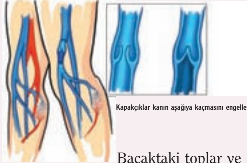
Kapakçıklar kanın aşağıya kaçmasını engeller.