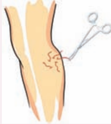
Pake eksizyonları Lokal anestezi ile dikiş gerektirmeyen çok ufak deliklerden yüzeysel damarlar çıkarılır. Bu yöntem ana yüzeysel damarda varis bulunmayan sadece yan dal varisi olan hastalarda uygulanır.

likle yüzeysel toplar damarın çok geniş ve kıvrımlı olan hastalarda aşağıdaki yöntemlerin uygun olmadığı vakalarda tercih edilmektedir.